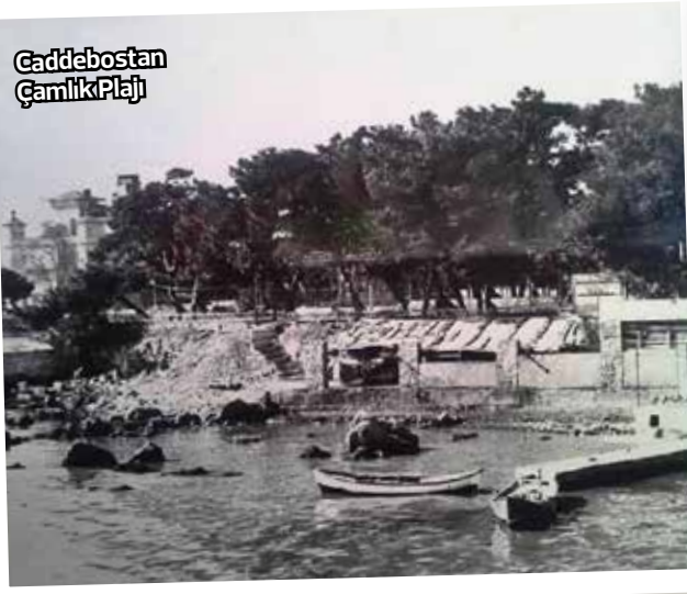
Caddebostan Çamlık Plajı