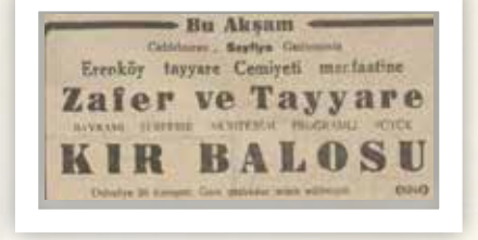
Caddebostan Sayfiye Gazinosu 1933