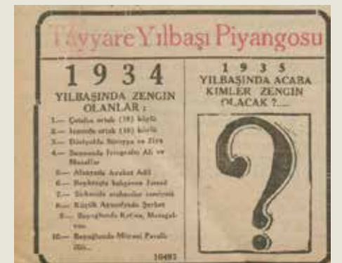
30 Aralık 1934- Milliyet: ilginç bir milli piyango ilanı