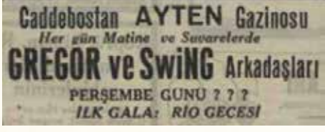
Caddebostan AYTEN Gazinosu 1944