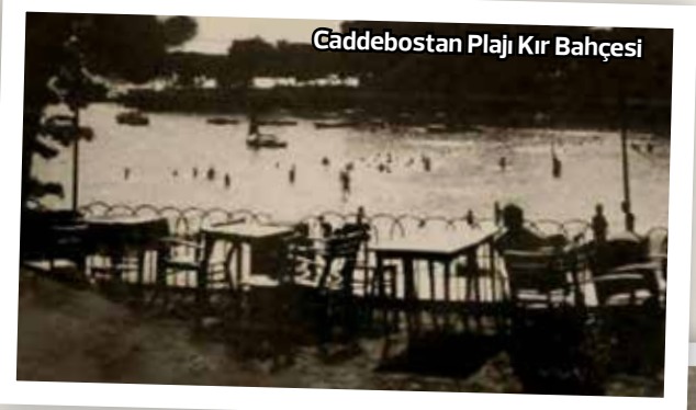
Caddebostan Plajı Kır Bahçesi