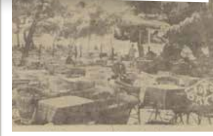
Caddebostan Gazinosu 1933