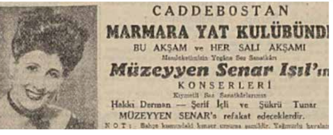
Caddebostan Gazinosu 1933