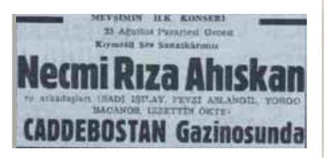
Caddebostan Gazinosu 1952