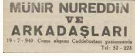
Caddebostan Gazinosu 1940

IV. yüzyıl sonunda imparatorlar Theodosius ve Arcadius'ın valilik ve danışmanlık görevlerini yapan dönemin güçlü devlet adamı Rafinus'un kendisine bir villa inşa ettirdiği, ayrıca bir liman, manastır ve kilisenin de yapıldığı Caddebostan sahili yüzyıllar sonra tenha, tekinsiz ve hırsız, eşkiyanın gezdiği bir yer olarak Caddebostan olarak adlandırılmış. Sayfiye geleneğiyle birlikte paşaların köşklarinin görülmeye başladığı Caddebostan'nda en büyük değişim Ragıp Paşa'nın sahil köşküyle olmuş ve semtin ismi de Caddebostan'ndan Caddebostan'a devşirilmiştir. Sonraki yıllarda plajı, bahçeleri ve gazinolarıyla Kadıköy'ün en önemli eğlence merkezlerinden biri olan Caddebostan, bu gazino ve eğlence geleneğini yakın zamana kadar sürdürmüştür.