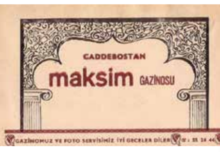
Caddebostan Maksim Gazinosu