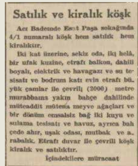
30 Mayıs 1942- Vakit: Satılık ve kiralık köşk ilanı