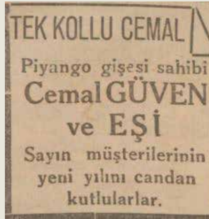
1 Ocak 1937- Açık Söz: Yeni yıl kutlama ilanı

Okurlarımızı bir parça geçmişe götürmek ve gülmüşmek için eski gazeteleri tarayıp ilginç ve Kadıköy'le ilgili ilanları derledik ve 23 sayımızda yer verdik. Yeni yılla birlikte ilanlar serimizi sonlandırıyoruz.