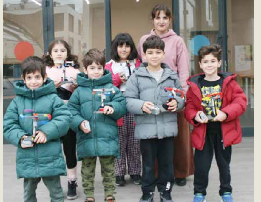
Atölye hakkında bilgi için https://ideacocuk.kadikoy.bel.tr/ adresini ziyaret edebilirsiniz, (0216) 414 38 10 nolu telefondan bilgi alabilirsiniz.