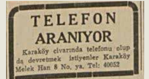
30 Kasım 1947- Cumhuriyet: Telefon devredilen günlerden herkesin akıllı telefon taşıdığı günlere