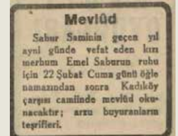
21 Şubat 1935- Akşam: Kadıköylü Emel Saburun için mevlit ilanı